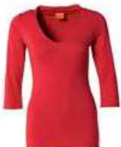
3/4 Arm oval Ausschnitt 95% Bio-Baumwolle, 5% Lycra 136214 | CHF 69.00