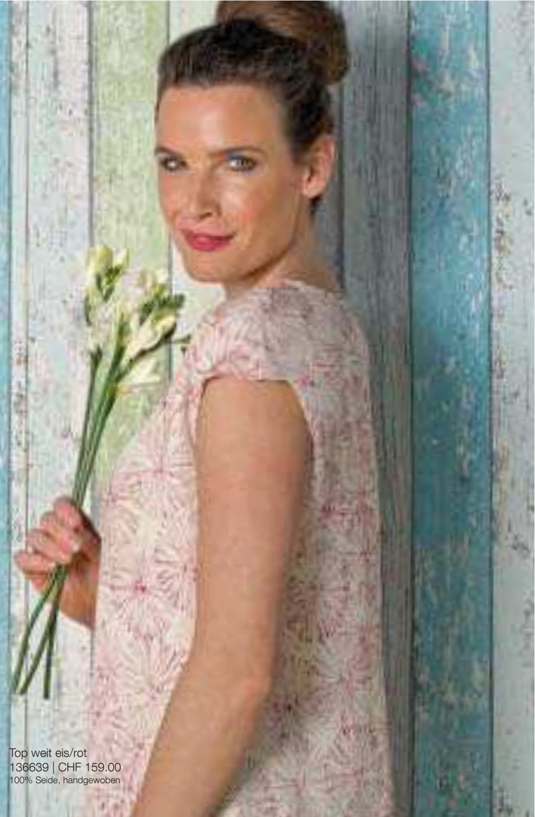
Top weit eis/rot 136639 | CHF 159.00 100% Seide, handgewoben