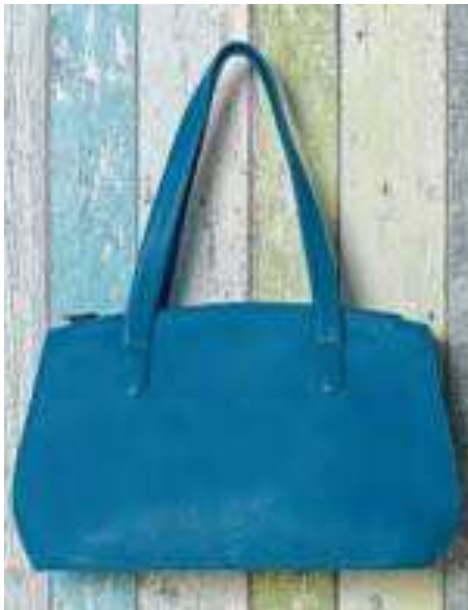
Handtasche ozean | 136856 | CHF 285.00 Rindsleder, 25 x 43 cm