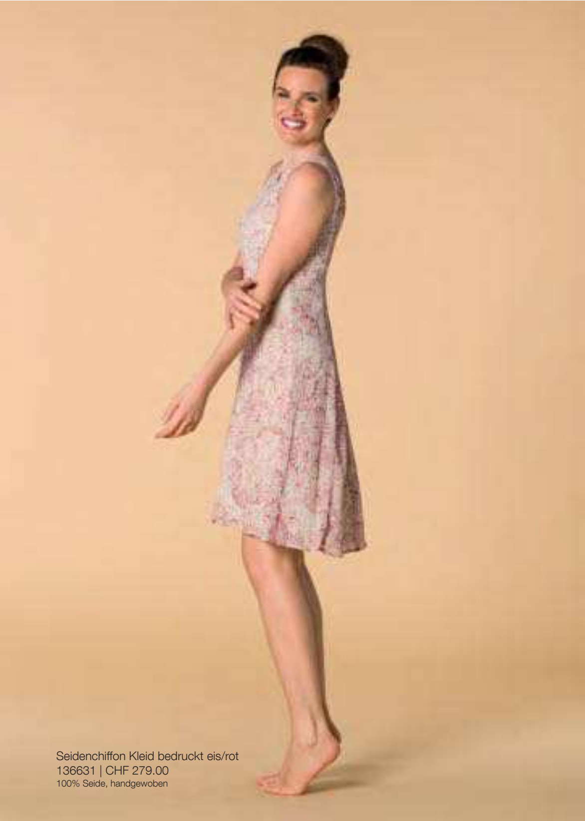
Seidenchiffon Kleid bedruckt eis/rot 136631 | CHF 279.00 100% Seide, handgewoben