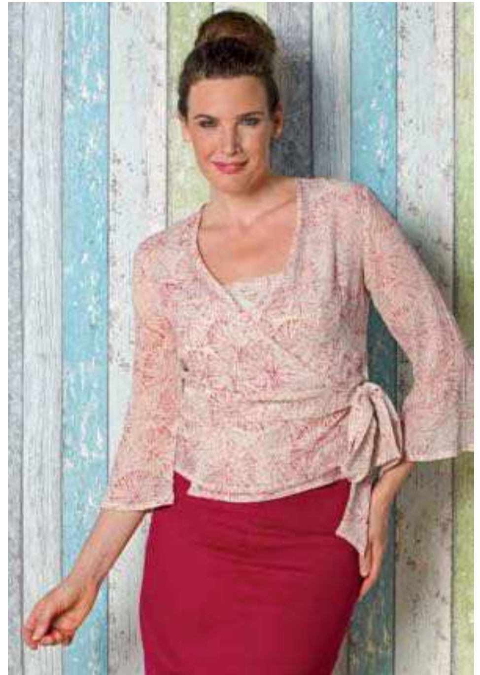
Wickelbluse bedruckt eis/rot | 136655 | CHF 189.00 100% Seide, handgewoben