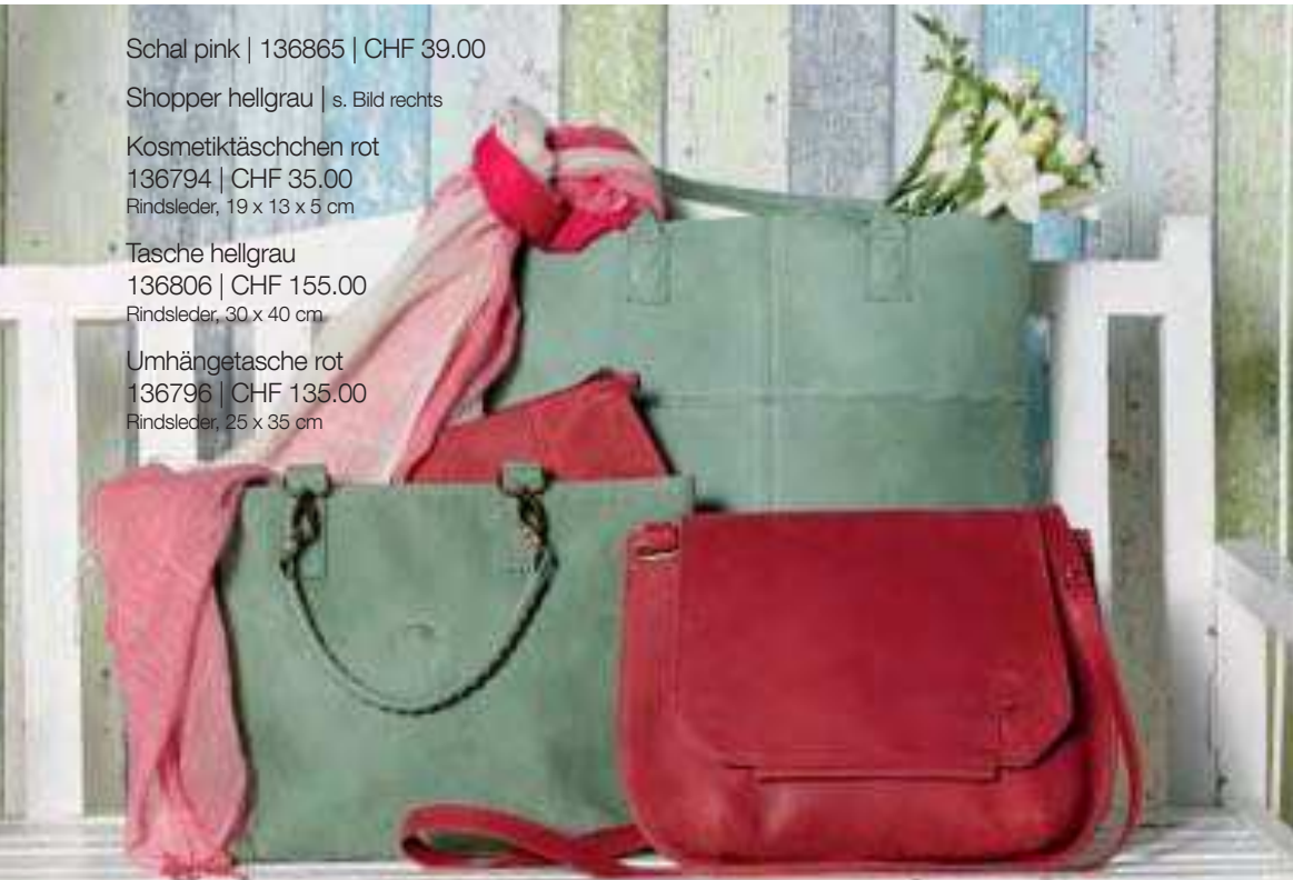
Rindsleder, 25 x 35 cm