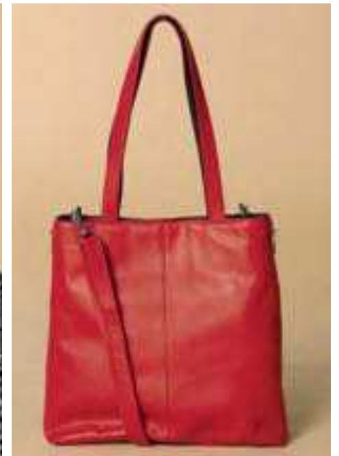
Umhängetasche rot | 136811 | CHF 195.00 Rindsleder, 38 x 43 x 9,5 cm