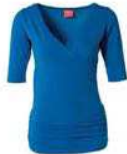
V-Ausschnitt gekreuzt 95% Bio-Baumwolle, 5% Lycra 136222 | CHF 79.00