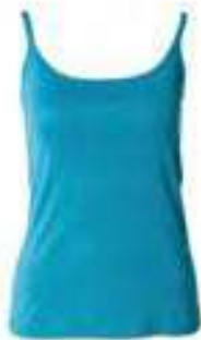
Spaghetti Träger Shirt 100% Bio-Baumwolle 136478 | CHF 39.00