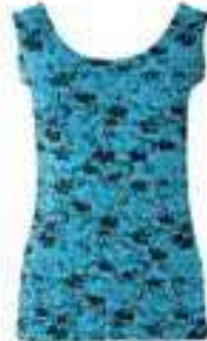
Shirt, Rundhals 95% Bio-Baumwolle, 5% Lycra 136318 | CHF 49.00