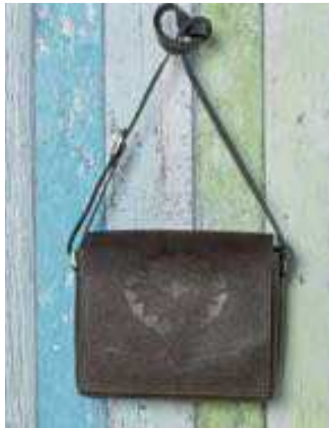
Umhängetasche grau | 136805 | CHF 135.00 Rindsleder, 20 x 22 cm