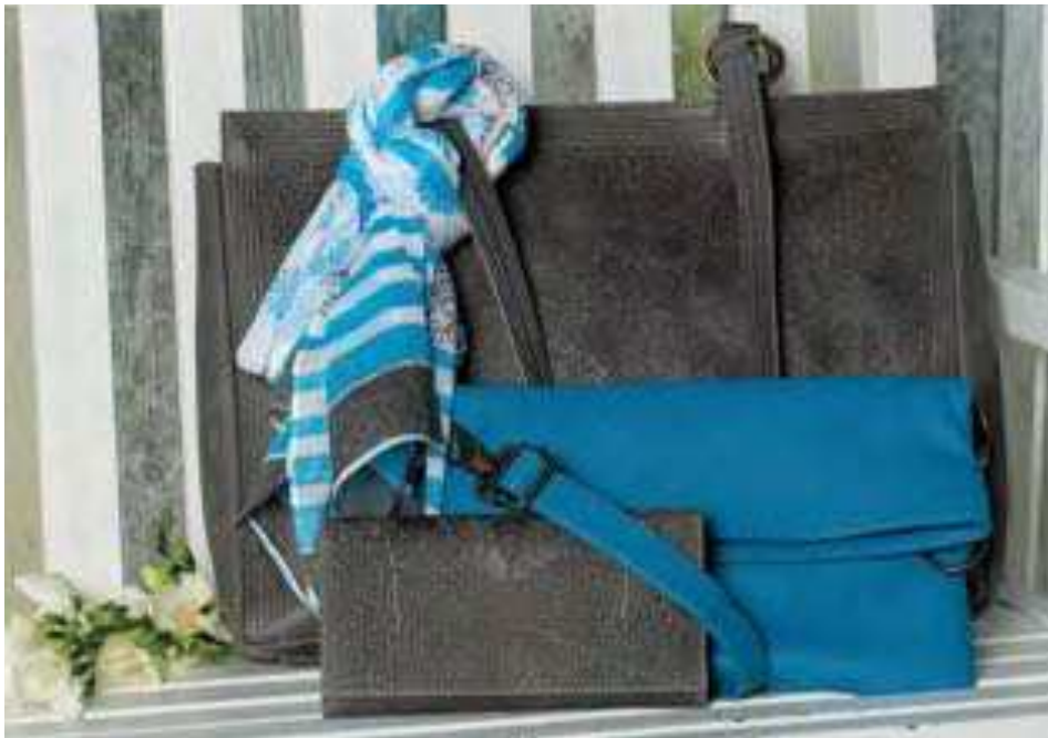
Shopper grau | 136806 | CHF 155.00 Rindsleder, 30 x 40 cm