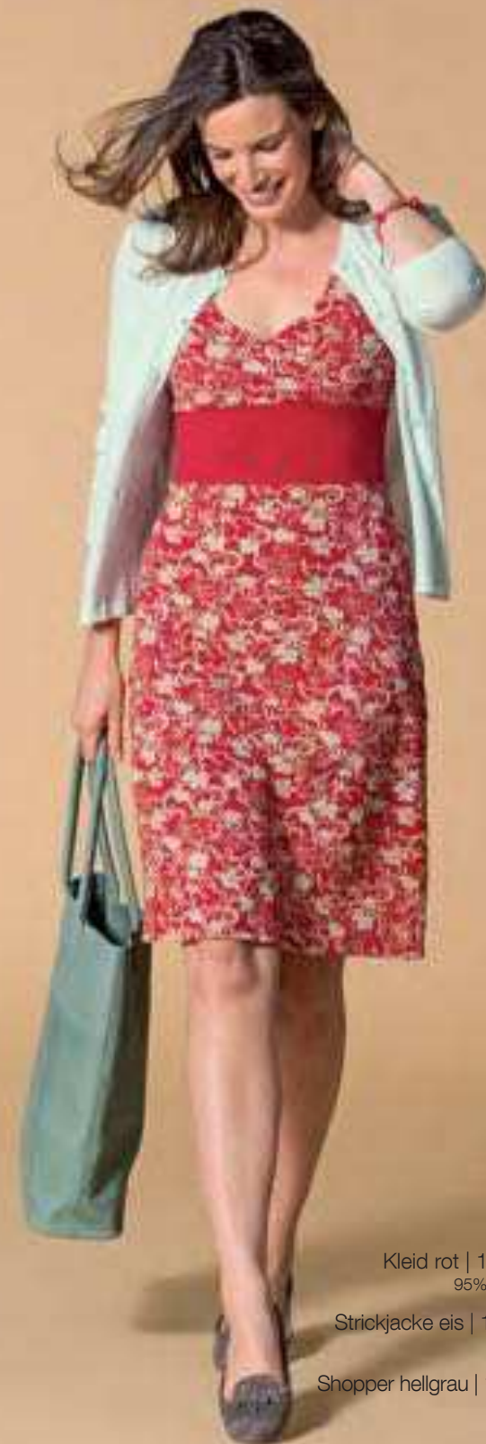
Kleid rot | 136362 | CHF 119.00