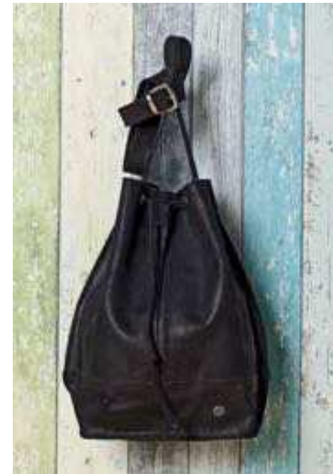
Beutel-Tasche schwarz 136843 | CHF 139.00 Rindsleder, 23 x 35 x 16 cm

Jupe frosch – ohne Unterrock 136254 | CHF 98.00 95% Bio-Baumwolle, 5% Lycra