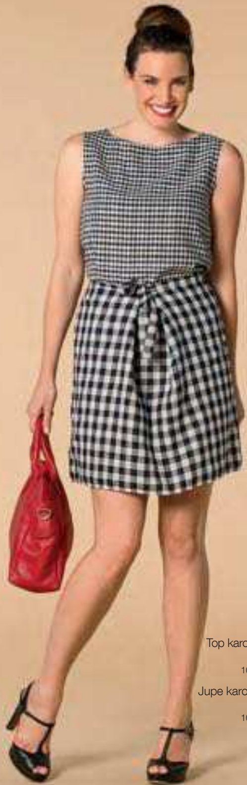
Top karo reversible schwarz/weiss 136680 | CHF 89.00 100% Baumwolle, handgewoben