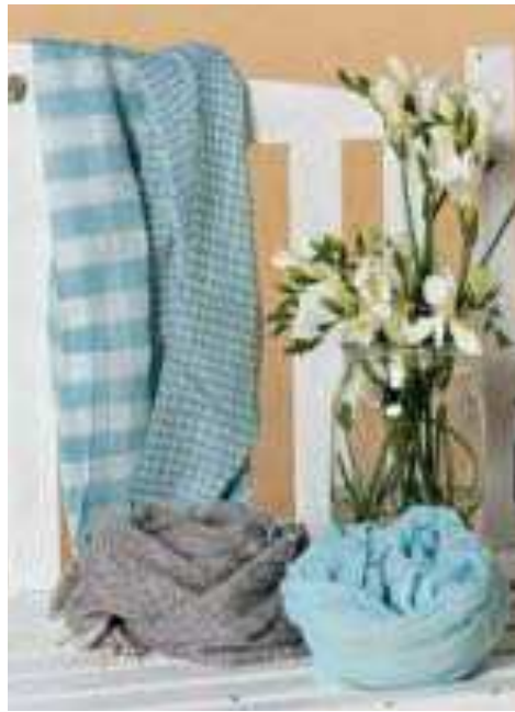
Schal gemustert eis | 136863 | CHF 49.00