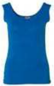
Shirt Rundhals 95% Bio-Baumwolle, 5% Lycra 136070 | CHF 49.00