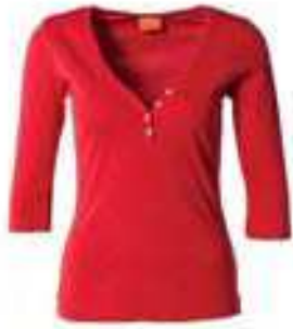
3/4-Arm Serafino 100% Bio-Baumwolle 136538 | CHF 59.00