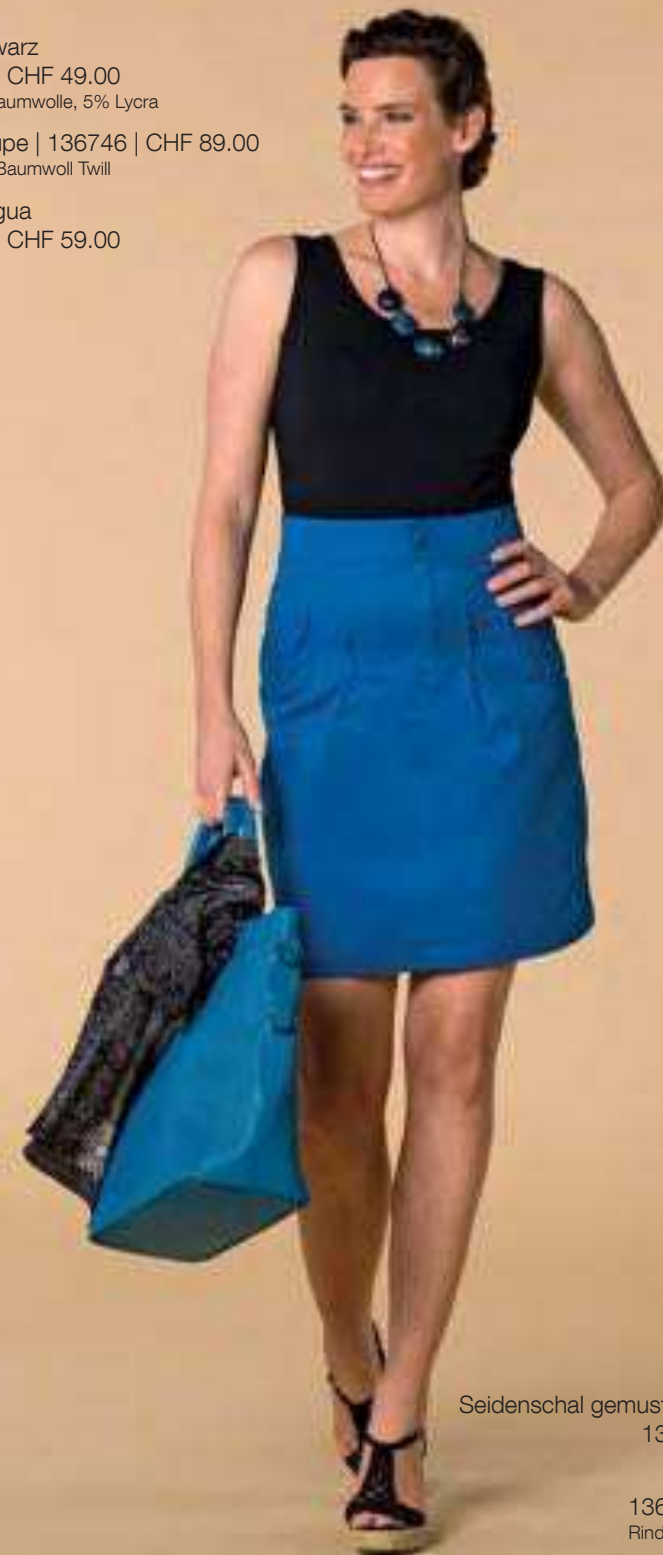
Seidenschal gemustert schwarz/weiss 136869 | CHF 59.00