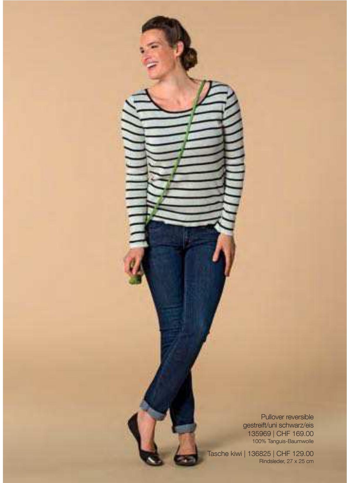
Pullover reversibel gestreift/uni schwarz/eis 135969 | CHF 169.00 100% Tanguis-Baumwolle