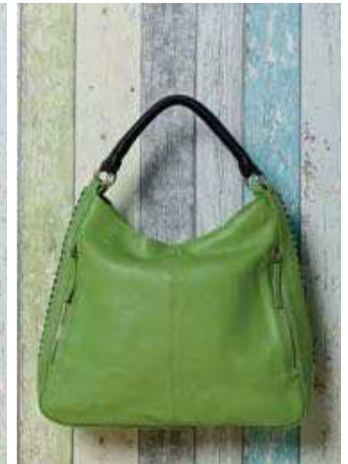
Schulter-Tasche kiwi/schwarz 136827 | CHF 198.00 Rindsleder, 42 x 31 cm