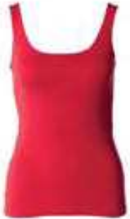
Sommer-Top 95% Bio-Baumwolle, 5% Lycra 136306 | CHF 59.00