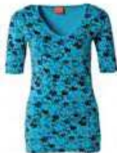
T-Shirt V-Ausschnitt 95% Bio-Baumwolle, 5% Lycra 136334 | CHF 69.00